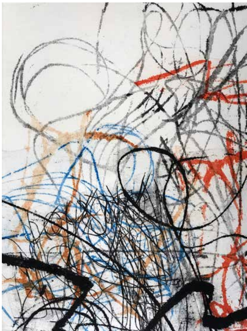
Colleen Sullivan. Stories: Monotypes