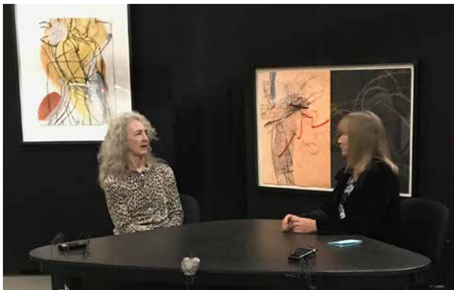
Colleen Sullivan Stories: Monotypes