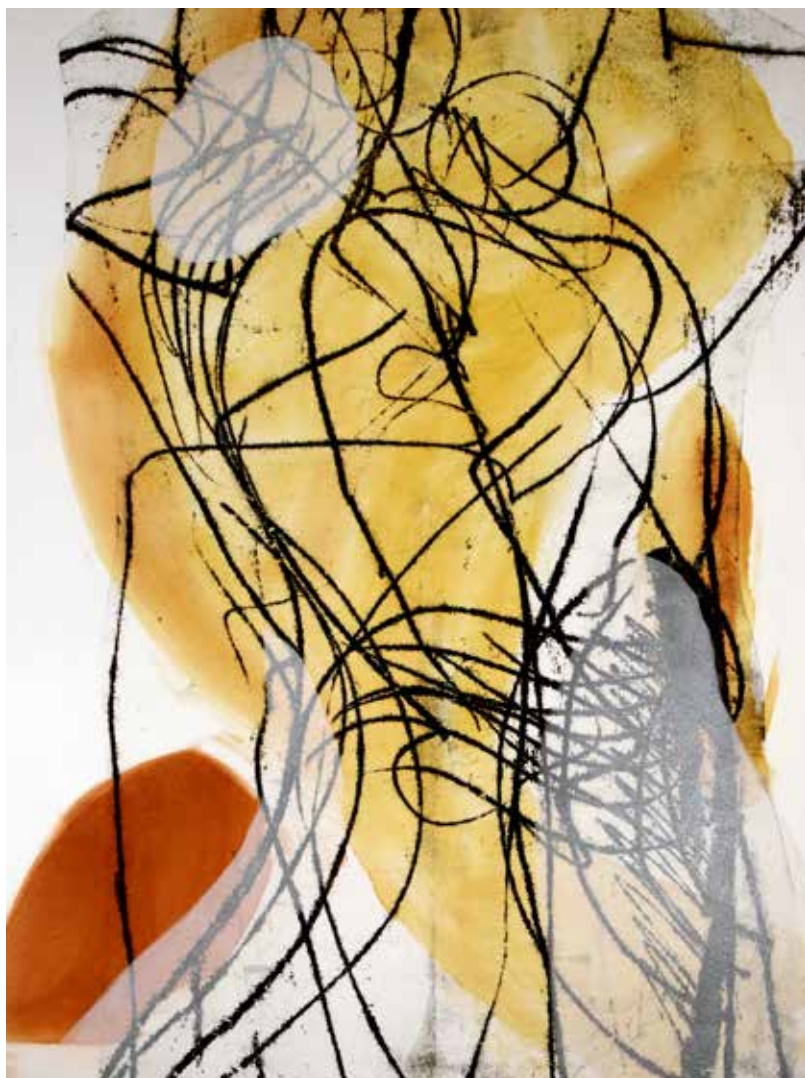
Colleen Sullivan. Stories: Monotypes