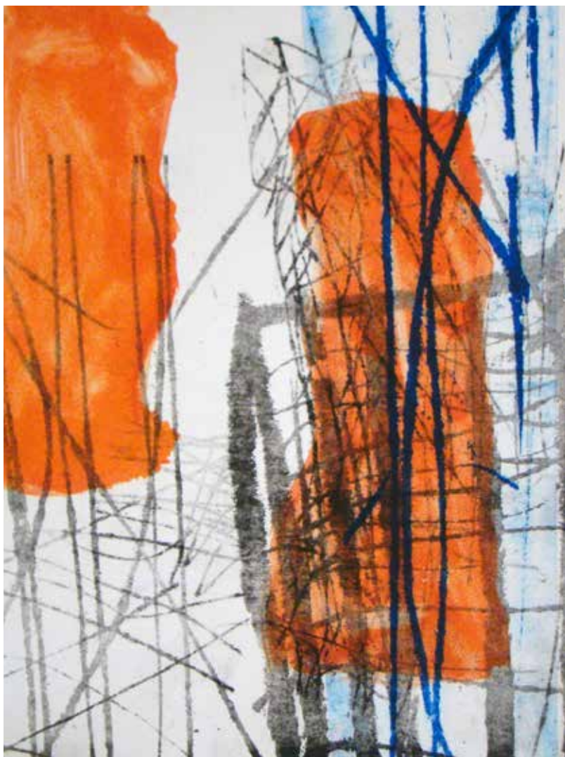
Colleen Sullivan. Stories: Monotypes