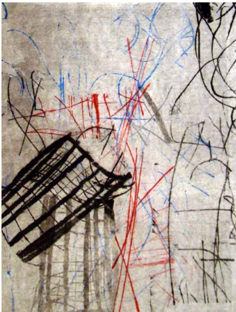
Colleen Sullivan. Stories: Monotypes