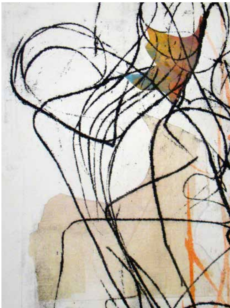
Colleen Sullivan. Stories: Monotypes