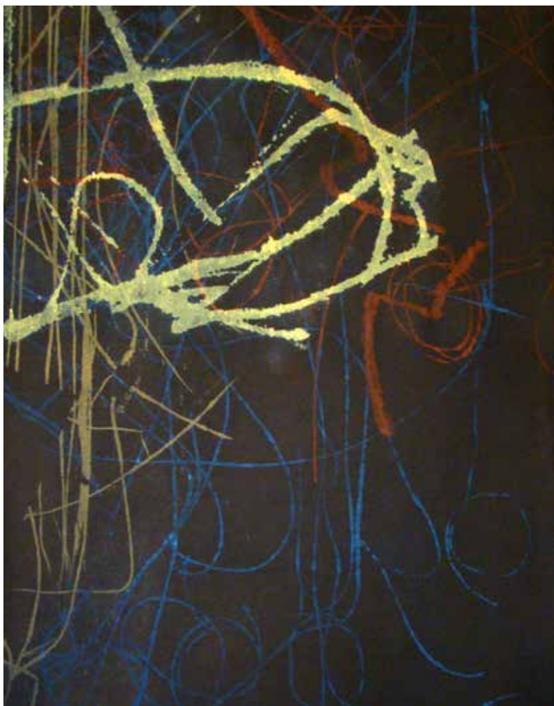
Colleen Sullivan. Stories: Monotypes