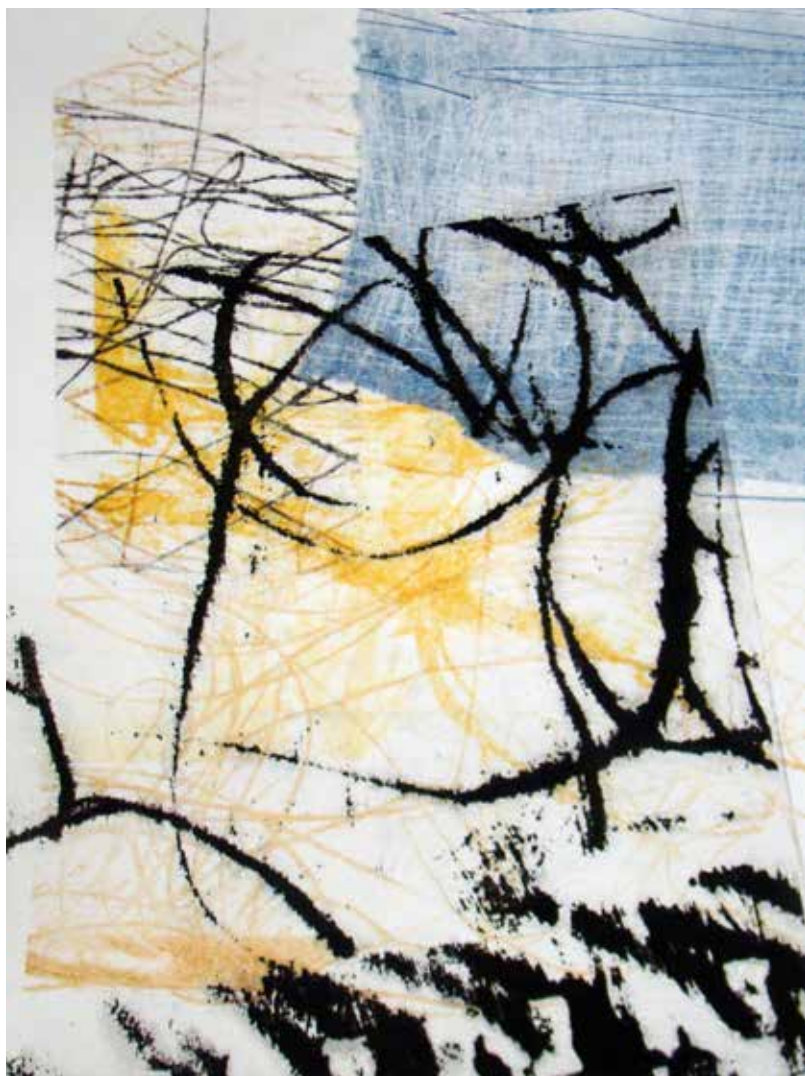
Colleen Sullivan. Stories: Monotypes