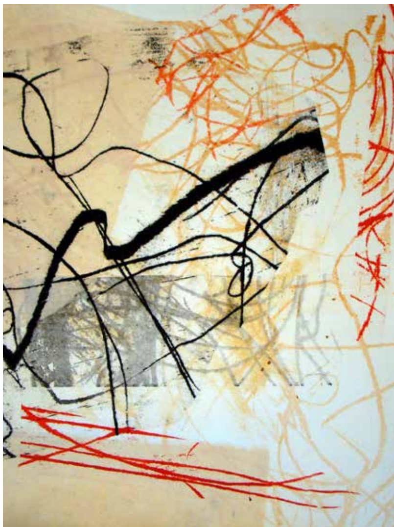
Colleen Sullivan. Stories: Monotypes