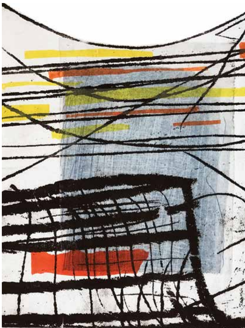
Colleen Sullivan. Stories: Monotypes