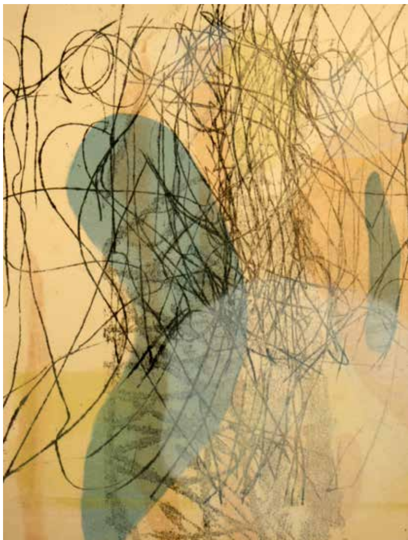
Colleen Sullivan. Stories: Monotypes