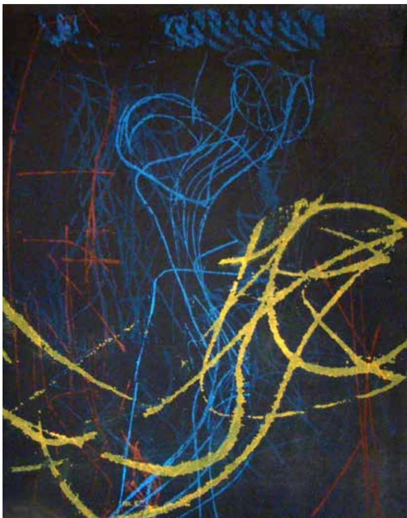
Colleen Sullivan. Stories: Monotypes