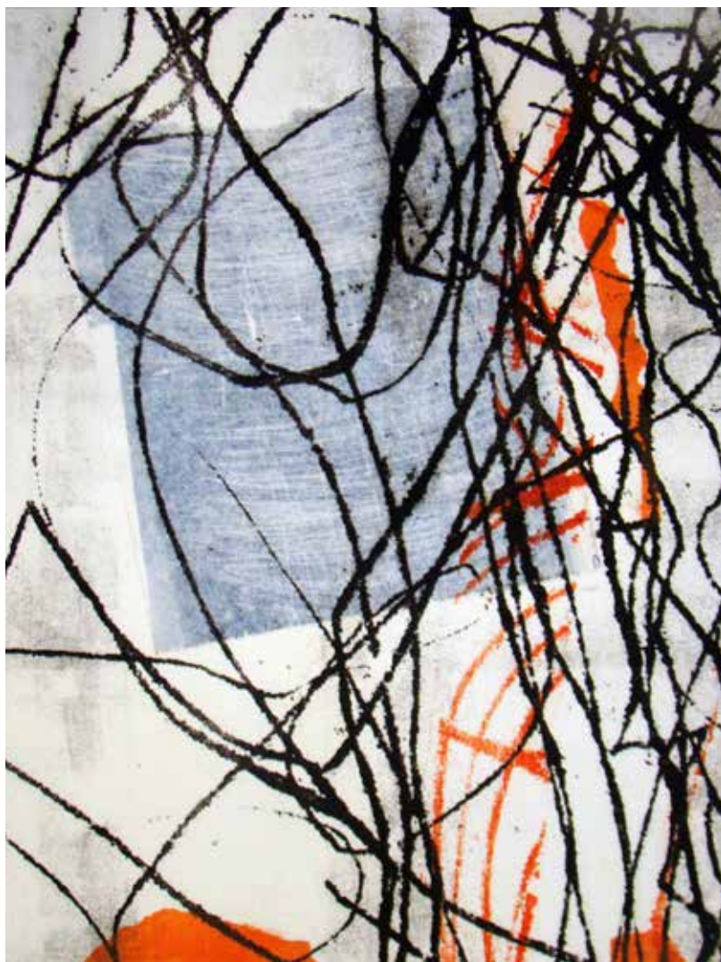
Colleen Sullivan. Stories: Monotypes