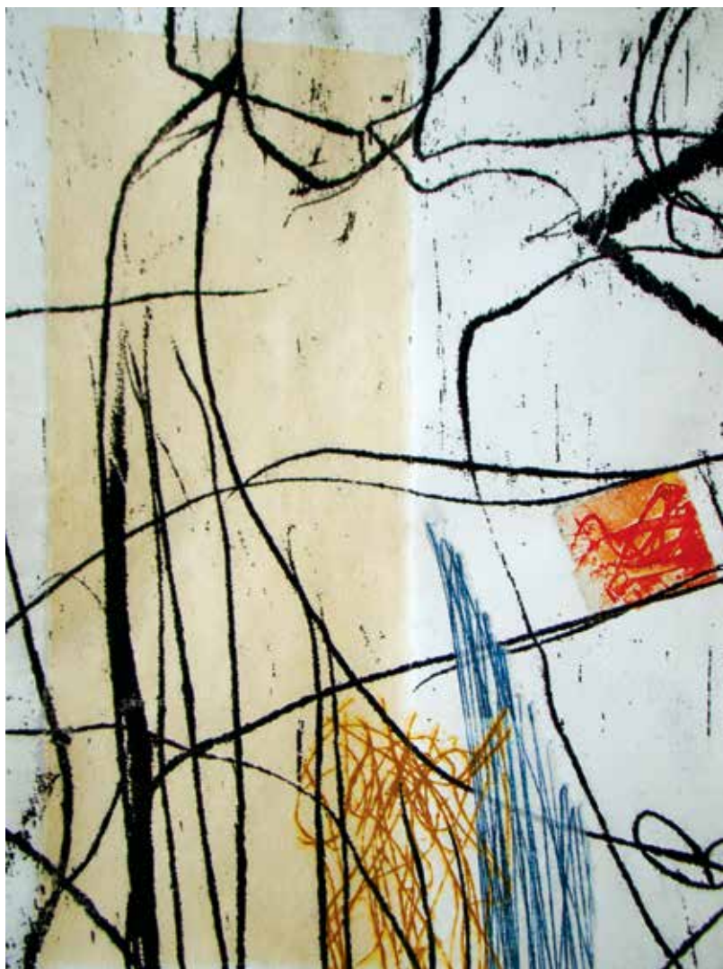
Colleen Sullivan. Stories: Monotypes