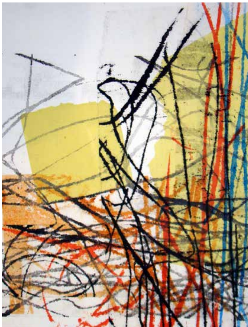
Colleen Sullivan. Stories: Monotypes