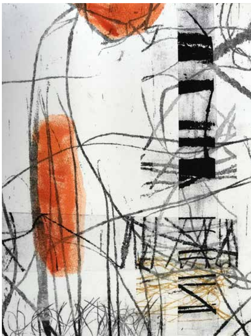
Colleen Sullivan. Stories: Monotypes