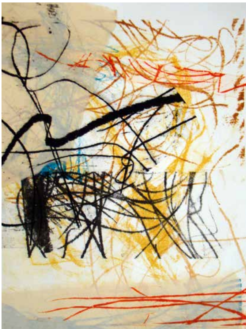
Colleen Sullivan. Stories: Monotypes