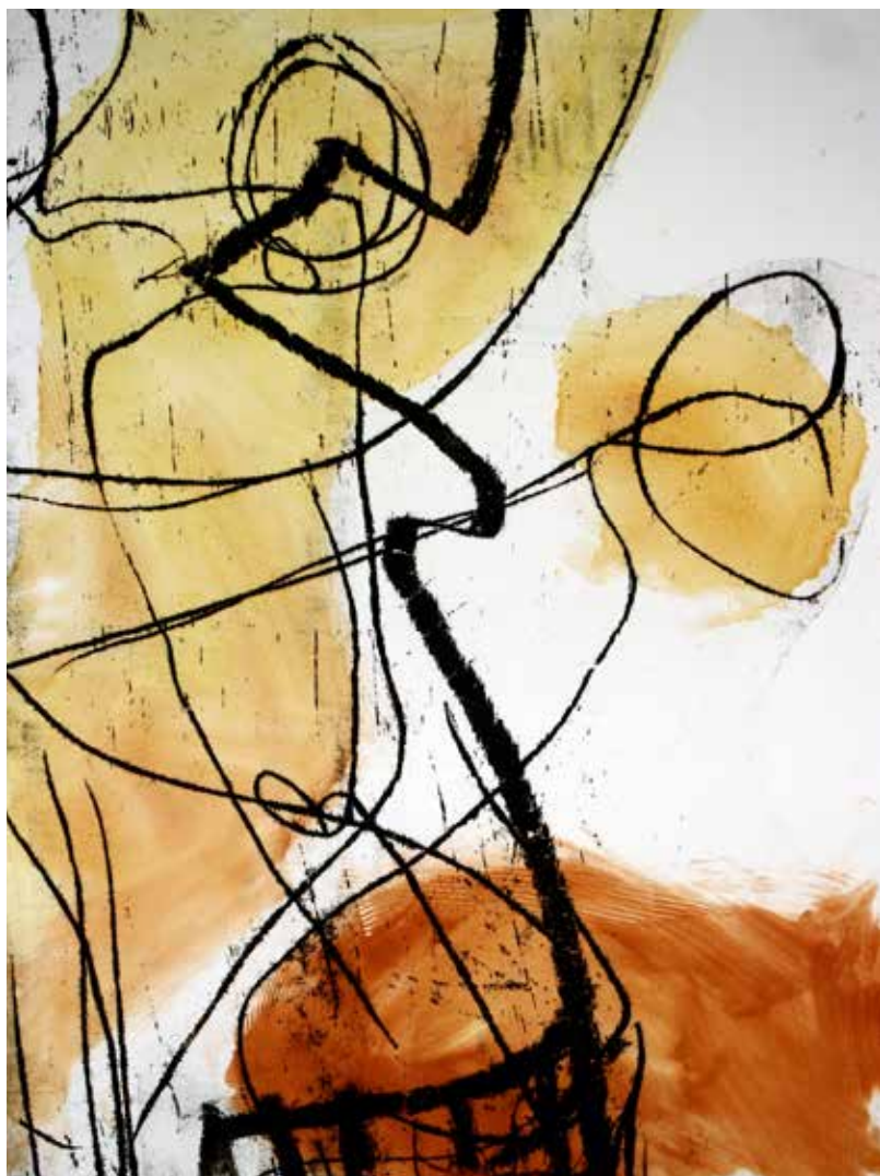
Colleen Sullivan. Stories: Monotypes