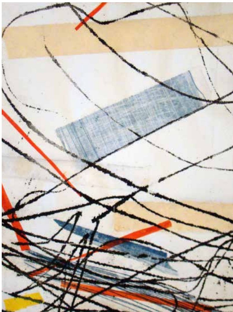
Colleen Sullivan. Stories: Monotypes