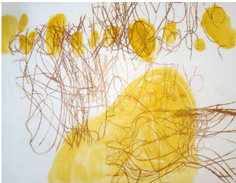
Colleen Sullivan. Stories: Monotypes